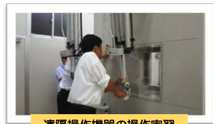
遠隔操作機器の操作実習