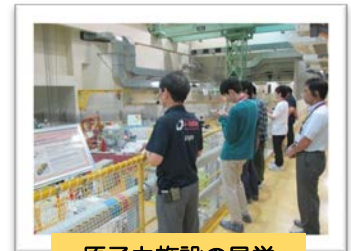
原子力施設の見学